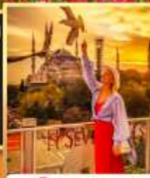
ลูฟท์อปเซเวนฮิลล์ส