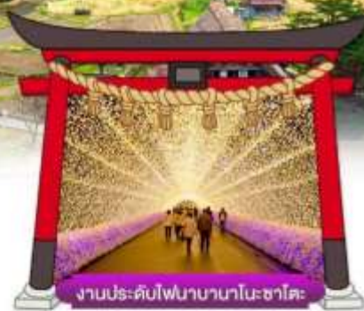
งานประดับไฟนาบานาโนะซาโตะ