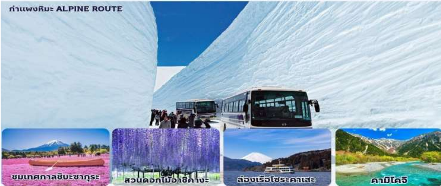
ชมเทศกาลชิบะซากุระ