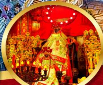
เจ้าแม่กวนอิมอ้อฮง

นมัสการองค์เจ้าแม่กวนอิม อายุกว่า 600 ปี