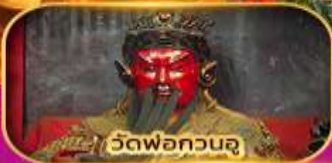
วัดพ่อกวนจู