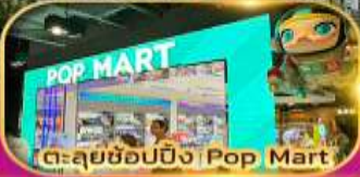
ตะลุยช้อปปิ้ง Pop Mart