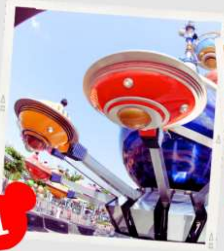
MAIN STREET USA