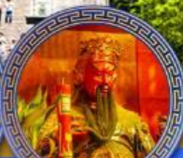
วัดกวนไท่