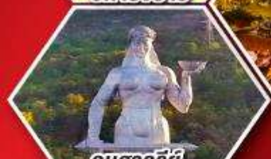
อนุสาวรีย์