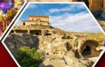
เมืองด้าอพลิสต์ซเคห์