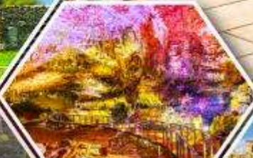
ด้าไฟรมีริอุส