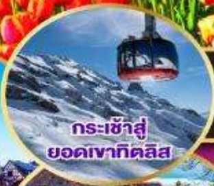
กระเช้าสู่ ยอดเวทาคิลิส