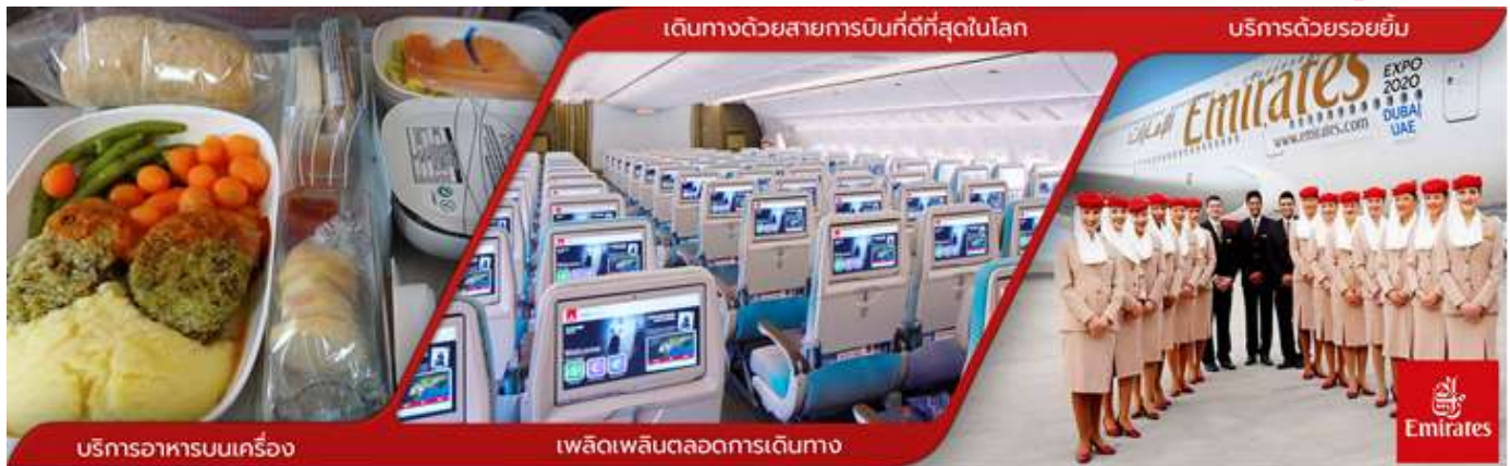
บริการอาหารบนเครื่อง

ทางบริษัทฯ ขอสงวนสิทธิ์ในการจัดที่นั่งบนเครื่องบิน เนื่องจากบัตรโดยสารเครื่องบิน เป็นแบบหมู่คณะ การจัดที่นั่งเป็นระบบ RANDOM ที่นั่งอาจจะไม่ได้นั่งติดกัน ทั้งนี้เป็นไปตามเงื่อนไขของสายการบินเป็นผู้กำหนด