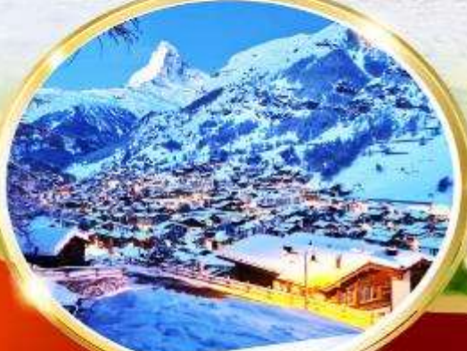
เซอร์แมท