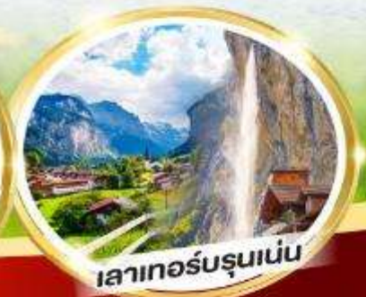
เลาเทอร์บรุนเนน