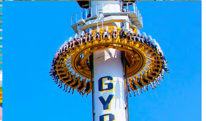
เที่ยง อีสรอาหารกลางวัน ณ สวนสนุกล็อตเต้เวิลด์ (เพื่อให้ท่านได้สนุกอย่างเต็มที่)